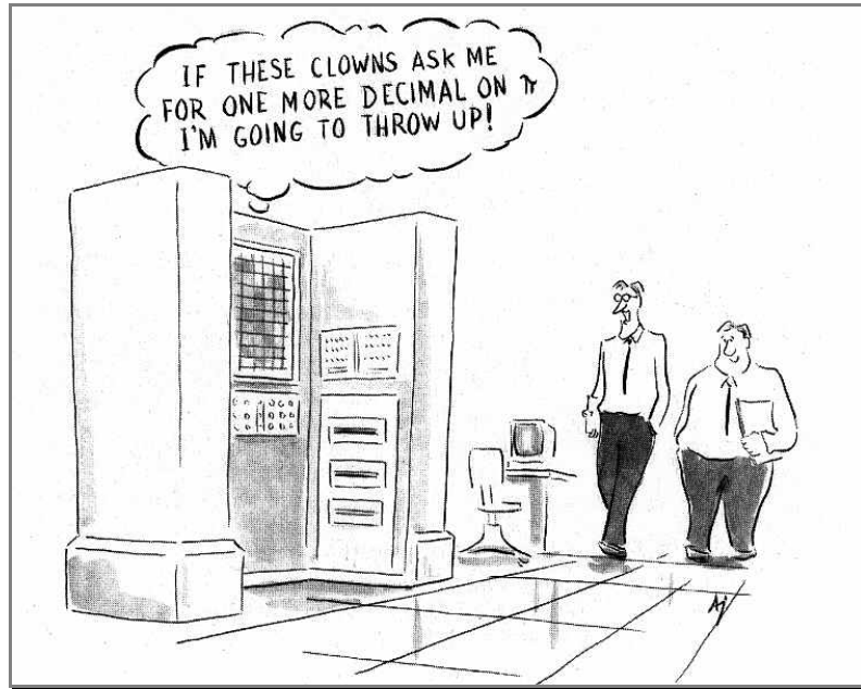
Digit hunting 43

Diese verschiedenen Interessengemeinschaften befassen sich alle mit dem gleichen Objekt, nämlich \pi . Doch ihre Stellung in der Gesellschaft könnte unterschiedlicher nicht sein. Professoren und Programmierer, die immer mehr Stellen berechnen, sind hoch angesehen. Ihre Forschung hat einen Nutzen und das ist in der heutigen Zeit das Ein und Alles. Der Klub der Freunde der Zahl \pi wiederum wird belächelt, weil ihm so viel an dieser Zahl liegt. Die Mitglieder des Klubs beschäftigen sich aus reiner Freude an dieser spannenden Zahl mit \pi . Auch Mathematikbegeisterte, die sich mit \pi befassen und bei Berechnungen zu einem falschen Resultat kommen, werden mit Kopfschütteln bedacht und man schreibt gar Bücher 44 über diese „Spinner“.